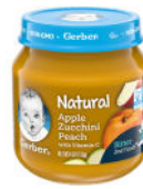
Apple Zucchini Peach