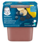
Banana Blackberry Blueberry