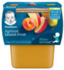
Apricot Mixed Fruit