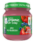
Apple Wild Blueberry

Solamente marca Gerber® 2nd Food Organic; envases de cristal de 4 onzas solamente; solo los tipos específicos listados abajo: