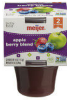
Apple Berry Blend