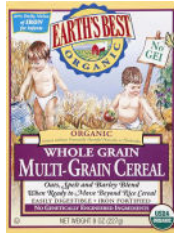
Grano Entero Multigrano