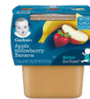
Apple Strawberry Banana