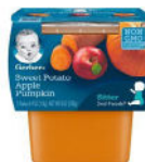
Sweet Potato Apple Pumpkin