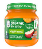
Sweet Potato Apple Carrot Cinnamon