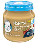
Apple Strawberry Banana