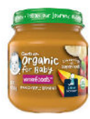
Mango Apple Banana