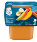
Banana Carrot Mango