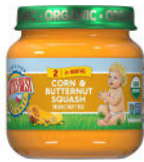
Corn Butternut Squash