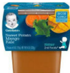
Sweet Potato Mango Kale