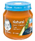
Pear Carrot Peas