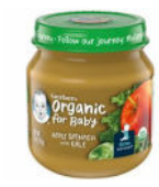
Apple Spinach Kale