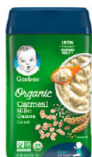
Oatmeal/ Avena Millet Quinoa