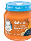
Sweet Potato Banana Orange