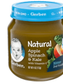
Apple Spinach Kale