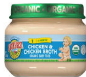
Chicken & Chicken Broth

Solamente para participantes amamantando exclusivamente; solamente marca Earth's Best Organic; frascos de cristal de 2.5 onzas solamente; solo los tipos específicos listados abajo: