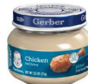
Chicken & Gravy