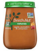
Apple Pumpkin Cinnamon