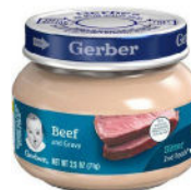
Beef & Gravy

Solamente para participantes amamantando exclusivamente; solamente alimentos segundos (2nd Foods) marca Gerber; frascos de cristal de 2.5 onzas solamente; solo los tipos específicos listados abajo: