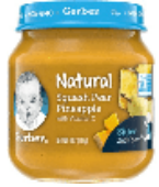
Squash Pear Pineapple