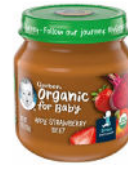
Apple Strawberry Beet