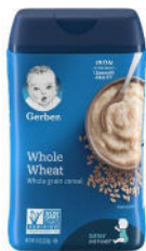
Whole Wheat/ Trigo Integral