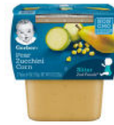
Pear Zucchini Corn