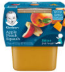
Apple Peach Squash