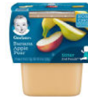
Banana Apple Pear