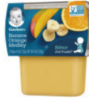
Banana Orange Medley