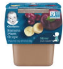
Banana Plum Grape