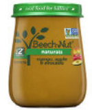
Mango Apple Avocado