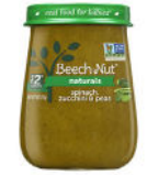
Spinach Zucchini Peas