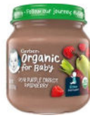
Pear Purple Carrot Raspberry