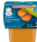
Sweet Potato Corn