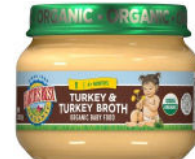
Turkey & Turkey Broth