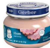
Ham & Gravy