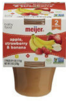
Apple Strawberry Banana

Solo alimentos marca Meijer; paquete-doble plástico de 2 a 4 onzas; solamente los tipos específicos listados: