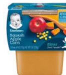
Squash Apple Corn