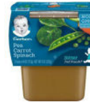
Pea Carrot Spinach