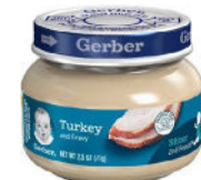
Turkey & Gravy