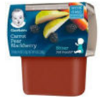
Carrot Pear Blackberry